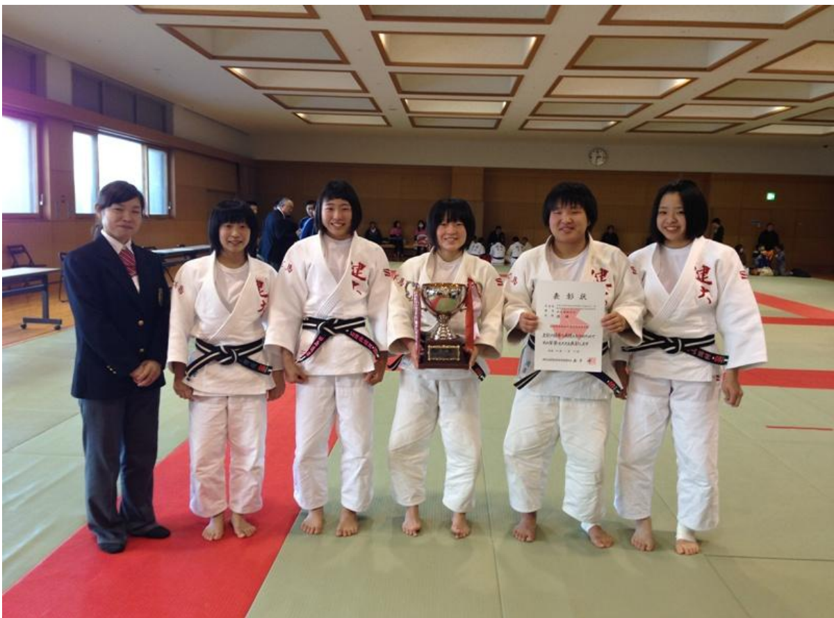
女子優勝校 健大高崎