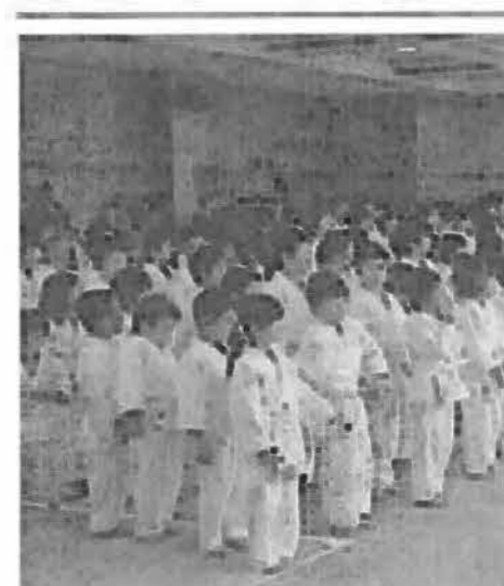
第40回 渋川市市民 柔道 第スポーツ祭 大会