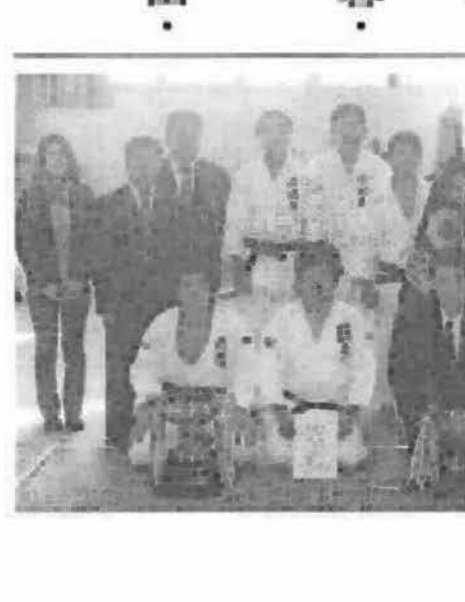
第40回 渋川市市民 柔道 第スポーツ祭 大会