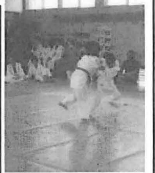
道場連合大会 第五回大会が、九月二日ぐんま武道館において盛大に行われた。結果は次のとおり。

甘楽町立第一中学校柔道場において行われた。小学生の男女選手が元気に試合を行いました。