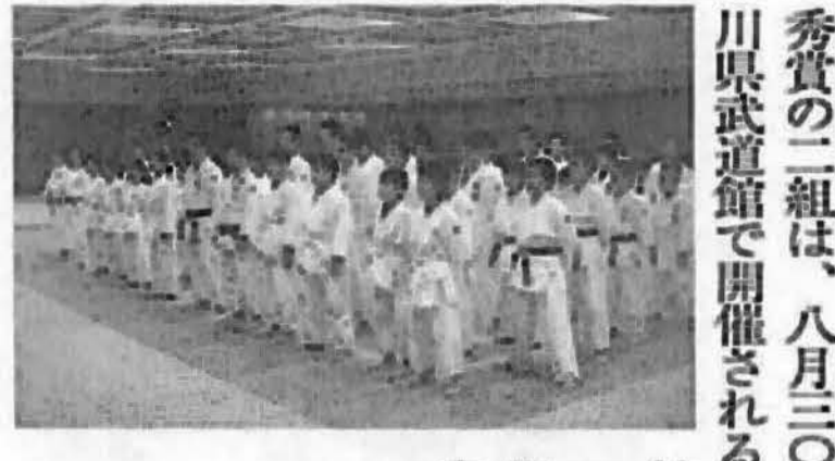
競技会への出場が決した。場が決した。