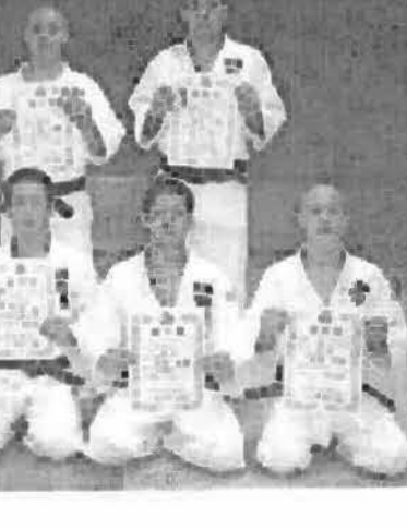
男女個人各階級のインターハイ出場決定者