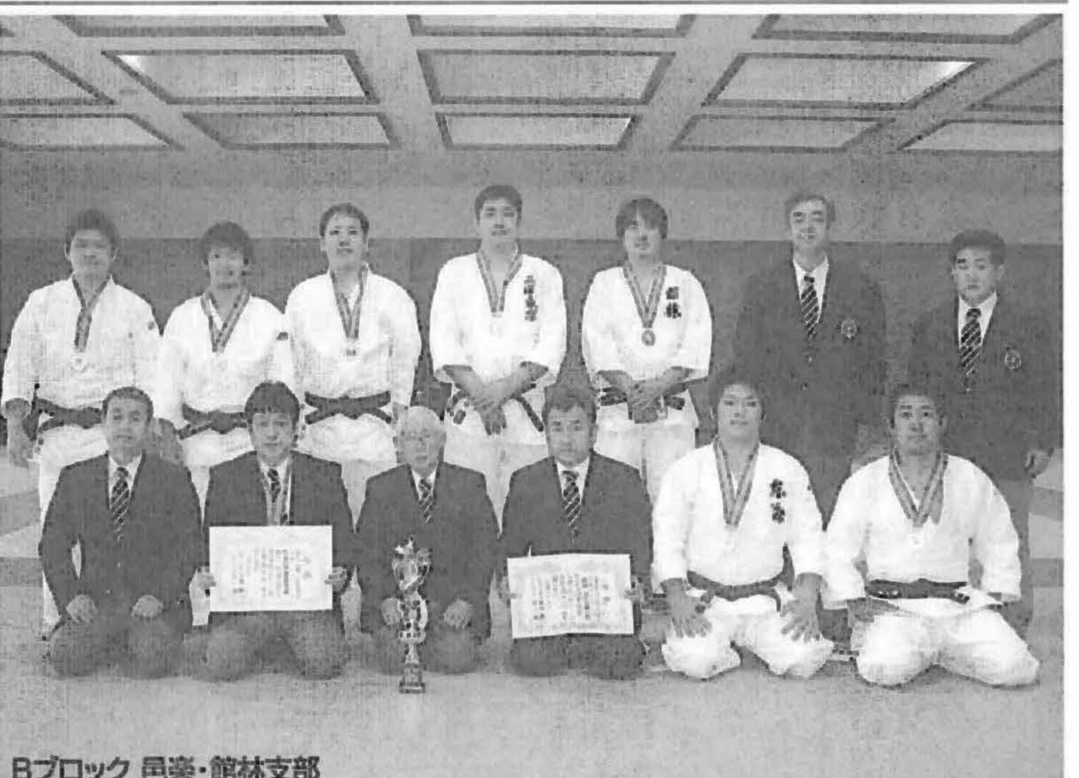
Bブロック 邑楽・館林支部