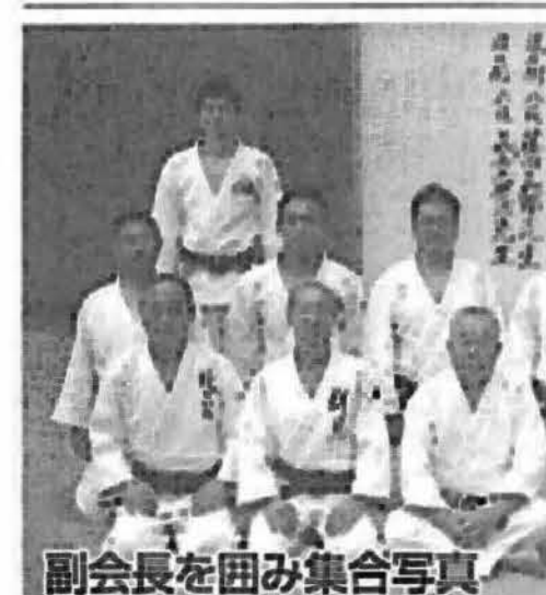
副会長を囲み集合写真