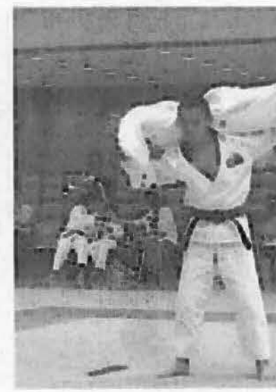
六月六日群馬武道館で開催された。結果は以下のとおり。それの組の氏名は「取」受の順