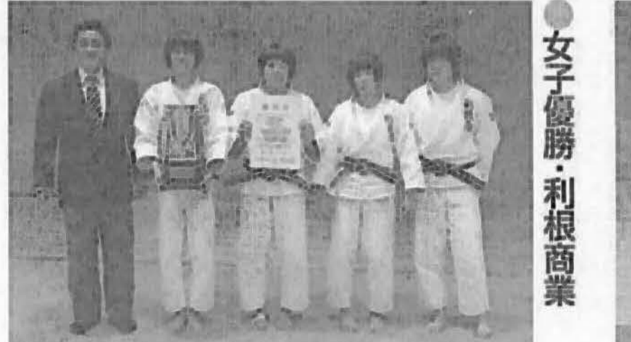
女子優勝 利根商業