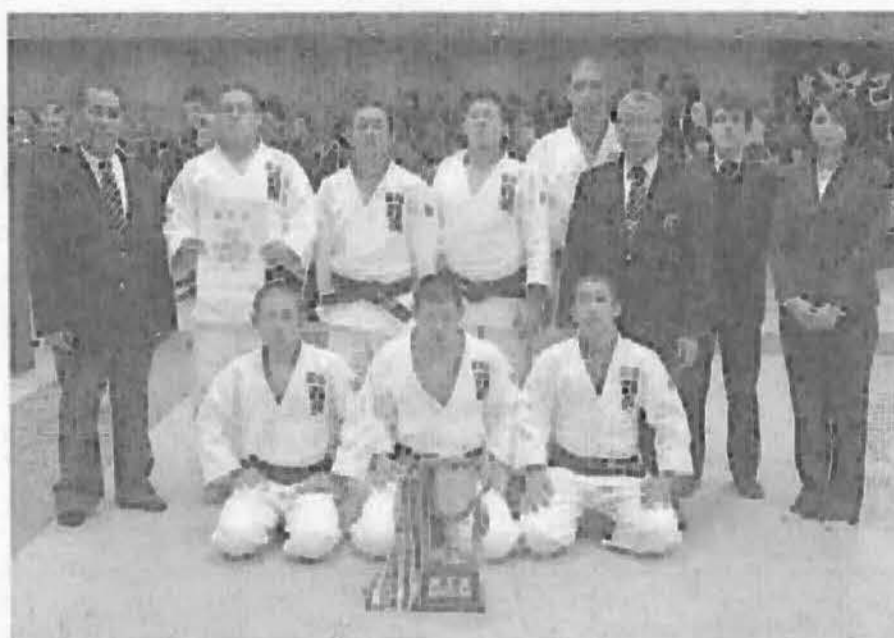
男子Aブロック優勝 育英