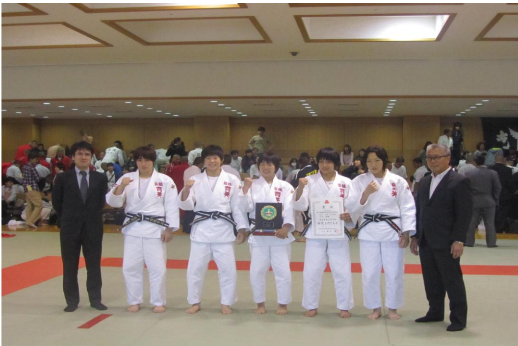
女子団体優勝 育英高校