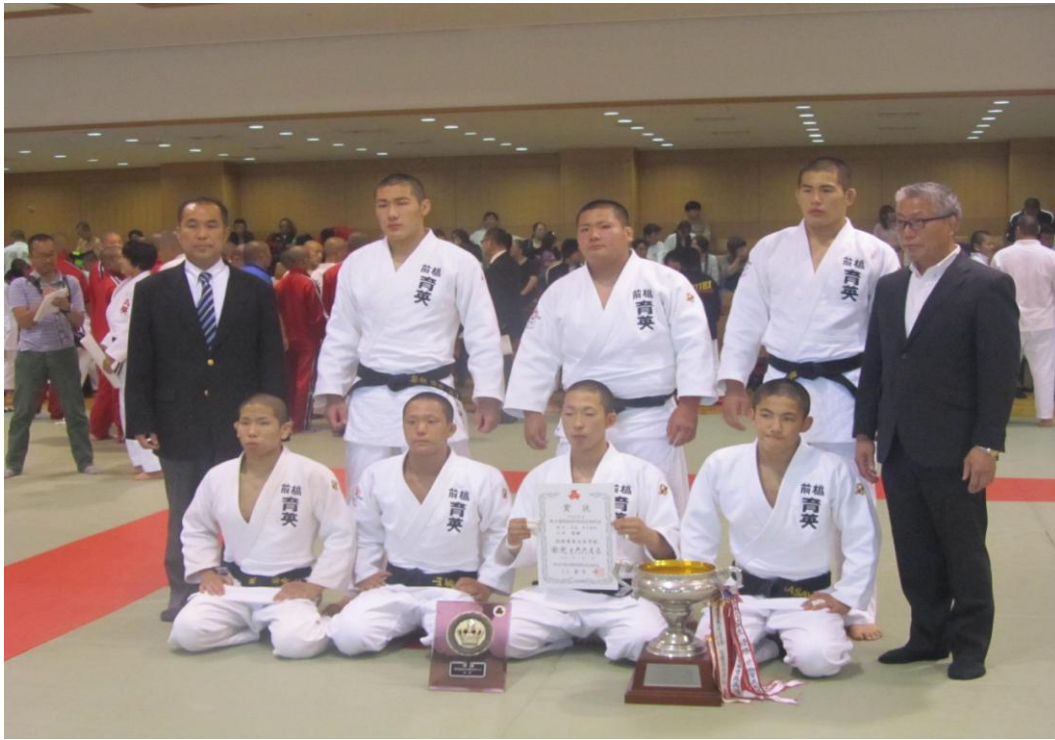
男子団体優勝 育英高校