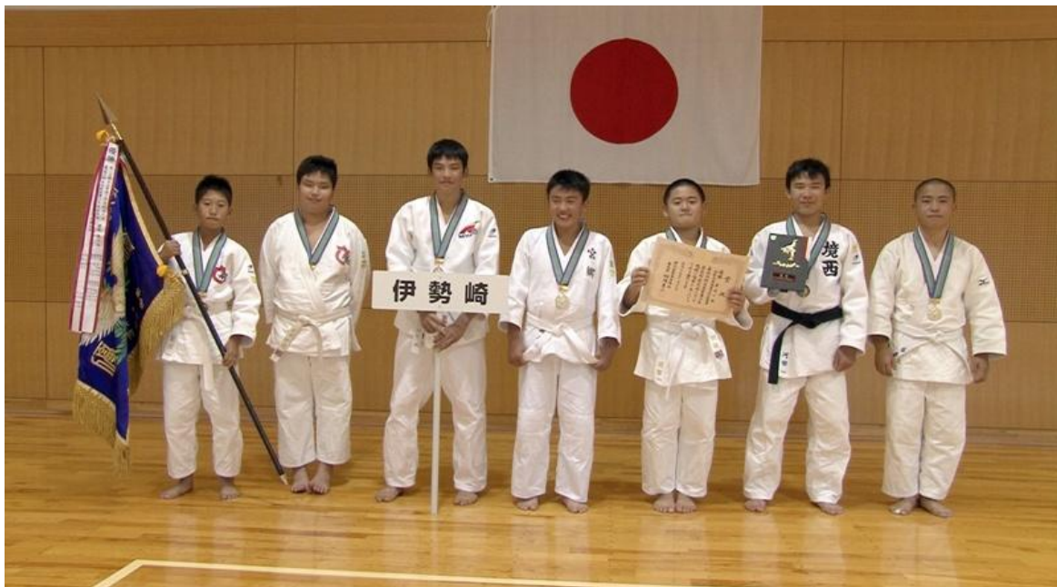
優勝 伊勢崎警察署少年柔道教室